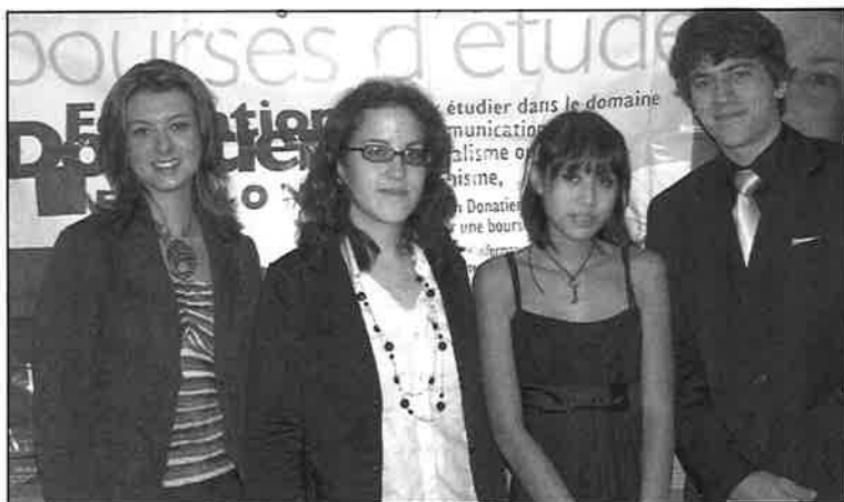
Quatre boursiers 2006-2007 de la FDF