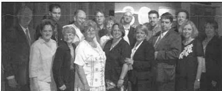
La famille des journaux francophones s'est réunie les 6, 7 et 8 juillet à Saint-Jean (T.-N.-L.) pour célébrer les grandes réussites de la presse écrite en milieu minoritaire.