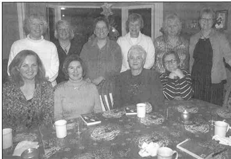
Comme le veut la tradition, les succès du Goût de vivre sont célébrés chaque année.

La direction du journal continue sa chronique hebdomadaire à la radio de CBC et dans le journal local anglophone pour mettre en vedette la communauté acadienne et francophone de la province. Enfin, ce printemps a été spécialement occupé par les élections provinciales.