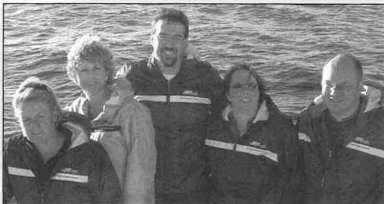
Le conseil d'administration de l'APF 2006-2007

Afin d'assurer le financement adéquat et à long terme de l'ensemble des activités de l'APF, la diversification des sources restera la ligne directrice de la politique de financement du bureau national. Cette stratégie s'est une fois de plus traduite, en 2006-2007, par des demandes de subventions au programme Développement des communautés de langue officielle – volet vie communautaire de Patrimoine canadien, au Fonds du