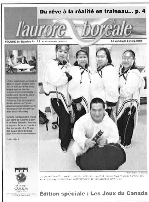
L'Aurore boréale a couvert les Jeux du Canada en mars 2007

Ce fut une année fructueuse pour La Liberté qui a publié en tout 1 572 pages et de nombreuses éditions de 40 pages et plus. L'année fut parsemée de projets spéciaux dont deux qui ont eu lieu en mars 2007 à l'occasion de la Semaine de la francophonie. La Liberté a alors publié un cahier d'activités de Bicolo qui a été distribué dans les écoles françaises, ainsi qu'un répertoire des organisations distribué à même le journal. L'équipe a continué à mener à bien ses projets parallèles à la pu-