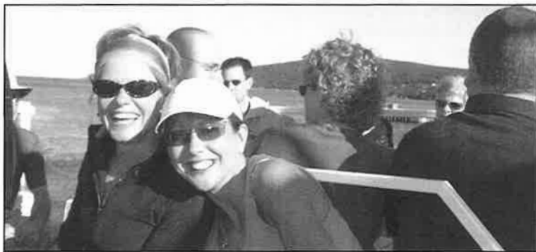
Croisière au soleil couchant à Terre-Neuve-et-Labrador